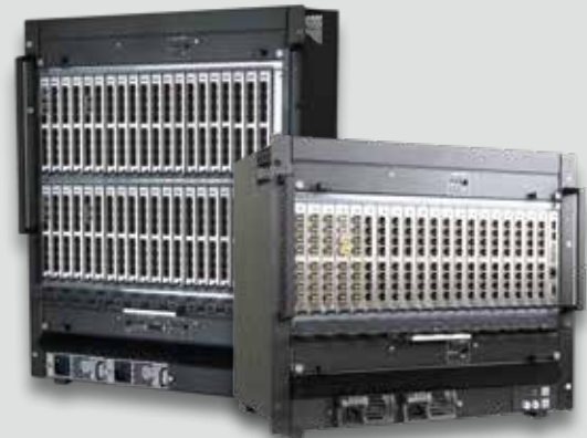
Das Draco tera Matrixsystem. Erhältlich in einem Größenspektrum von 8 bis 576 Ports.